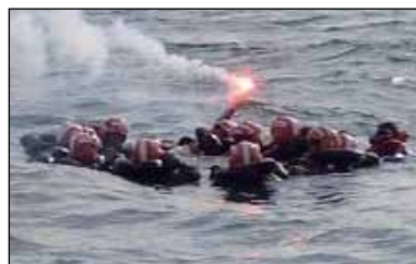
Náufragos en prácticas reunidos en círculo y con bengala de mano disparada

Si tenemos dudas sobre cómo usarlas es muy importante ser capaces de leer las instrucciones, muy claras, que figuran en ellas. Unos segundos perdidos son a buen seguro menos importantes que un accidente más que añadir a la situación.